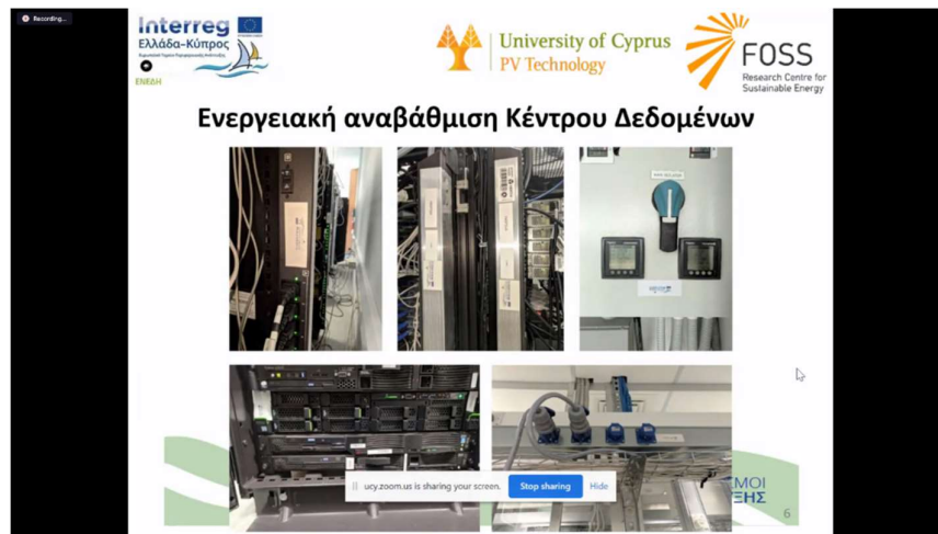
Εικόνα 2: Κέντρο Δεδομένων